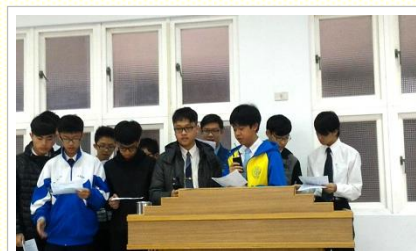
青少年上台宣告奉獻

最後，青少年在主面前尋求，在平時生活和福音生活有更確定且具體的奉獻，除了填寫奉獻心願書以外，並且上台宣告。在開放上台奉獻時，台前已被瘋狂愛主的青少年擠滿，與同伴上台宣告奉獻書，有的奉獻與同伴一同晨晚興、有