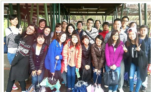
青職聖徒相調交通

在三月十九、二十日，八會所青職藉着宜蘭相調之旅帶進更多相調的機會，也邀請幾位福音朋友。大家很享受一同配搭。在晚上的詩歌分享，大家分享自己所享受的基督，有姊妹交通其