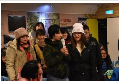
聚會中福音朋友介紹

和大家在一起這兩天，是我來臺灣交換學生這麼久時間中，第一次覺得最釋放自己的時光。