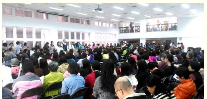
建造神家的事奉乃是供應生命的事奉

因此·需要天天飲於耶穌的靈·喫祂作素祭·我們就成為我們所喫的·這就是基督徒該有的人格。在生活中我們該如何操練呢？需要每日呼求祂的名·吸入祂的話·實行身體的生活·操練靈·需要經歷主與我們的靈同在·也就是恩典與我們同在·將祂活出·使我們成為祂的彰顯·就如同保羅所說『現在活着的·不再是我·乃是基督在我裏面活着。』(十會所 曾姊妹)