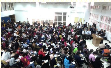
桃園市召會姊妹事奉相調特會

四月十六日桃園市召會姊妹事奉相調特會，在桃園市召會一會所舉行。姊妹三百八十位，弟兄三十七位，