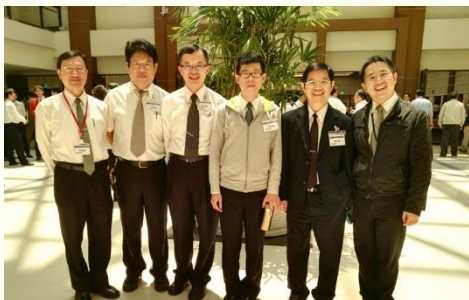
參加弟兄集調更新異象與啟示

經過這次的弟兄集調，真是翻轉我的觀念。服事主多年，不知不覺異象就模糊，因此參加前向主禱告，求主讓我看見異象與啟示。