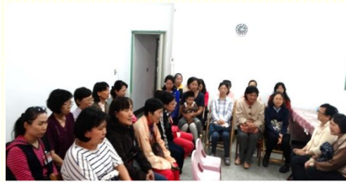
禱告經歷耶穌基督之靈全備的供應

感 謝主！在這次福音行動中，我經歷到在自己裏面是軟弱的，但在基督的身體裏，我們卻是神的軍隊。藉着禱告，叫我們經歷耶穌基督之靈全備的供應，使我們放膽向楊梅秀才區這些客家庄的