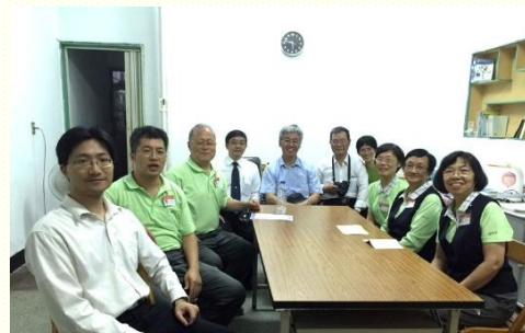
與壯年班學員配搭開展得着加強

因 着主的憐憫和恩典，有分於這次秀才區為期五天的開展。第二天與壯年班學員一同配搭，