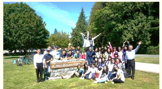
在史丹利公園(Stanley Park)騎腳踏車