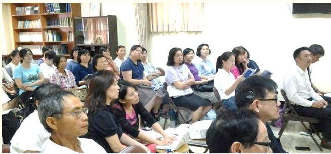
北部手語聽損聖徒集中相調

相調聚會的前一天，姊妹們正在交通並禱告主，聚會缺聽打服事該怎麼辦？這時一位姊妹問起我是否可以配搭服事？我順服的答應了。箴言十一章二十五節，『好施捨的，必得豐裕；滋潤人的，必