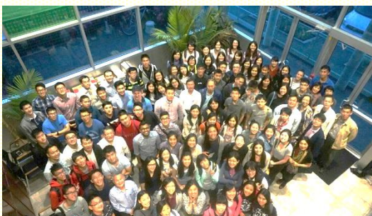
與大溫地區的大學生一同聚集