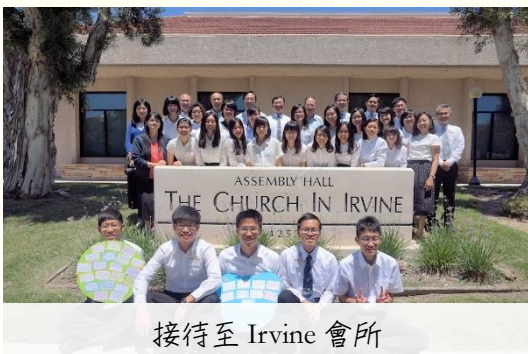
接待至 Irvine 會所

結束了一週的召會訪問和相調，我們前往南加州參加夏季訓練。二〇一六年夏季訓練於七月四日至七月九日舉行，內容爲出埃及記(四)結晶讀經。