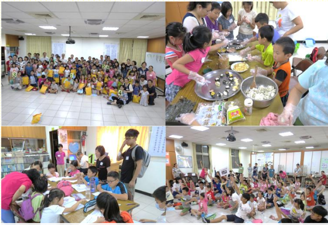
三會所兒童福音園地

一 會所兒童福音園地雖因颱風停班停課順延， 二 但主的祝福仍舊沒有減少。七月九日、十日二天共來了五十三位兒童，主日晚上展覽來了二十位家長，其中有三十八位福音兒童及十位福音家長。末了還有兩個家答應要參加七月十六日全召會的青職福音聚會。真是讚美主！阿利路亞！