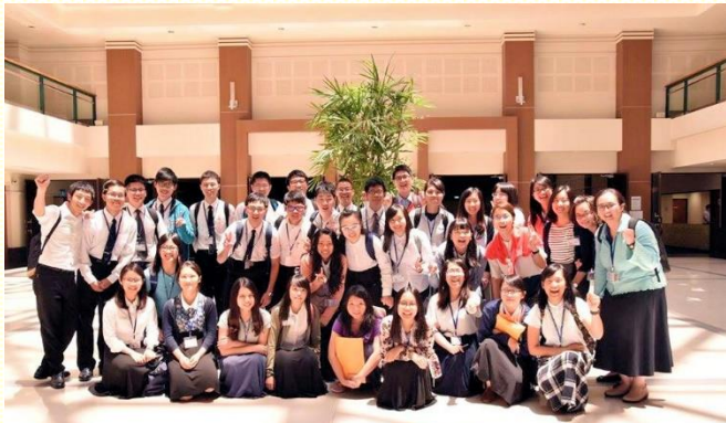
桃園大學生參加亞洲大學聖徒訓練

因着這次訓練，更看見英文的重要。兩年前參加美國夏季訓練，以及大學四年的成全，終於能在這次聚會中用英文享受喫喝主。特別是操練用英文準備信息考試的總結，過程雖然緊張，卻更進入信息的負擔，並將負擔化為禱告。我們要抓住機會操練，不用擔心不知要說甚麼，主會將滿滿的負擔加給我們。