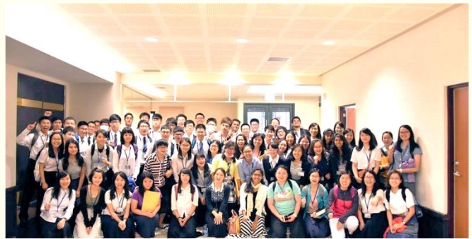
桃園、泰國、印度大學聖徒團體合照

第二天訓練的內容為二〇一六年夏季訓練——出埃及記結晶讀經(四)，每篇信息均由一位亞洲弟兄和一位美國弟兄共同配搭以英語交通。時間安排為每天上午兩篇、晚上一篇信息；早上一堂和下午兩堂的讀書時間，複習與進入已經釋放的信息，以為着豫備考試。考試時間於晚上及早上信息釋放前，以抽考的方式來進行，每組二十分鐘，包含開頭和結尾，並回答每篇信息綱目中所指定的問題，以臺上弟兄所強調的重點為發表來展覽。大學生們