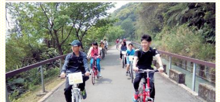
五會所青少年小排與戶外相調