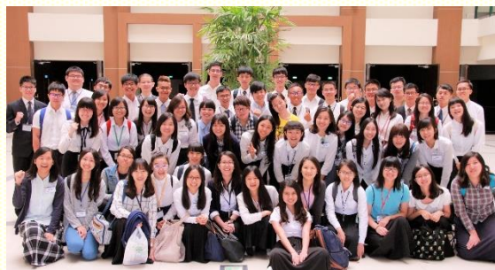
桃園市大學生參加全臺大專院校期初特會

信息頭一堂，弟兄向我們問了三個問題：第一，主觀的說，我的人生跟神正在作的事有沒有關係？第二，為甚麼神要人為祂造居所？第三，全然奉獻為着神家的建造意義為何？這實在摸着了到場每位的心，尤其弟兄說到全然奉獻不是打包式的奉獻，而是把我們所愛、所在乎的，一項一項奉獻給主。