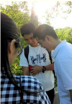
在開南校園接觸學生

十一會所在九月大學開學的這段期間，有為期三週的福音節期開展，從週一到週四，每天分為上午、下午、晚上等三個時段在開南大學校園傳揚福音。在九月八日下午五點半的第一場福音講座，共來了九位福音朋友和八十多位弟兄姊妹。這次福音傳講的主題是：『尋求人生的意義』。說到我們一生追求了許多事物，卻得不着滿足，甚至使我們受到挾制。我們真實的需要乃是得到真正的自由，就是接受基督。如何接受基督呢？方法很簡單，