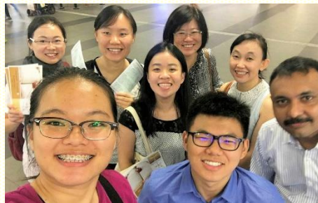
與當地聖徒配搭傳福音

這次開展很轉我的觀念，原本以為去那邊加強開展，剛強開拓傳福音，在兩週內帶很多人受浸得救。但實際上，我卻是去那裏與聖徒們同過召會生活。很享受與他們的相調，我們一起用餐、交通、禱告、聚會、看望和傳福音。也因着和他們調在一起，就更有負擔幫助他們在實行神命定之路的事上有突破和往前。