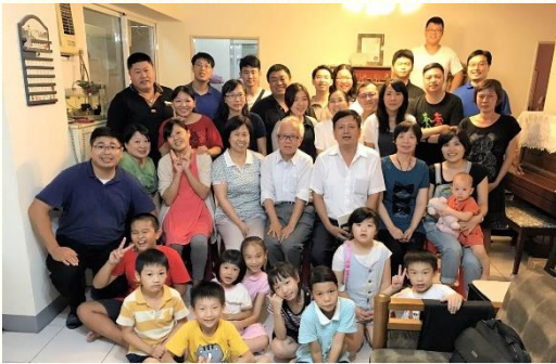
十六會所青職小排

十六會所參加今年九月青職特會的報名人數為三十五位，實際出席二十八位；其中青職報名二十位，實際出席十八位，四堂聚會平均出席十五位。會中受聖靈感動，有十三位起身宣告奉獻，願意週週出去牧養及家聚會有十位，願意週週出訪傳福音有十三位，至今年底有心願得着十三位果子。