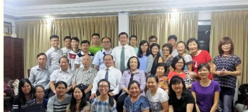
桃園聖徒赴新加坡開展兩週

新加坡召會盼望在二〇二〇年，主日聚會人數能達二千零二十位。已過八月份，先有弟兄訪問新加坡召會，並在集中相調聚會與眾聖徒交通，藉着增