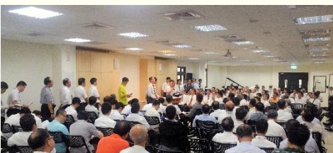
秋季弟兄事奉相調特會

在 十月二十二日上午九點至十二點，於桃園市召會十六會所舉行全桃弟兄們的事奉相調特會。主要是交通到這次在澳洲黃金海岸（Gold Coast）舉行之國際長老及負責弟兄訓練內容，主題『回歸召會的正統』。共有近兩百位的弟兄們一同進入交通及分享，會後各會所也在附近餐廳用餐，繼續有相調。而這次各會所有九位前去澳洲的弟兄們，一同配搭話語服事；其中也邀請臺北市召會服事同工弟兄，首先來為我們針對信息內容有加強的交通。