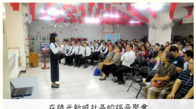
在陸光新城社區的福音聚會

學員與聖徒們天天三個時段的配搭開展，從早上七點開始到晚上九點，除了會所裏禱告交通外，幾乎都在社區裏接觸人傳福音。弟兄姊妹繞着陸光新城如同繞耶利哥城，堅定持續按照時段走出去，還有許多爭戰的禱告。至終人心思的高牆被攻破，原本不敞開的居民都願意聽福音，並得着平安之子