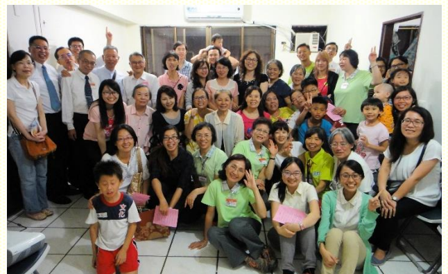
觀音區聖徒們與新人及福音朋友喜樂合影

的奴僕，不過我們全隊組員個個將全人奉獻給主，在靈裏禱告服事，與當地聖徒一起配搭建造，為着福音剛強開拓。