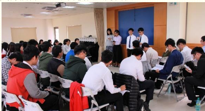
四位弟兄姊妹上臺見證

桃園大學聖徒期中特會於十一月十二日在十會所舉行，有五十多位的大學生參與。特會的負擔乃是『建立週週出外訪人的習慣』。在大學生的福音行動中，不是只有在專特的時間纔去接觸大學新鮮人的福音節期；更需要有『福音的生活』，養成天天傳福音、家聚會牧養人的習慣。