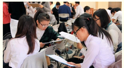
學生分小組讀職事信息

我們要看見神的心意乃是要全體事奉，彼前二章九節：『惟有你們是蒙揀選的族類，是君尊的祭司體系，是聖別的國度，是買來作產業的子民，要叫你們宣揚那召你們出黑暗、入祂奇妙之光者的美德。』這處經節給我們看見祭司的職分不是少數的，乃是全體的，