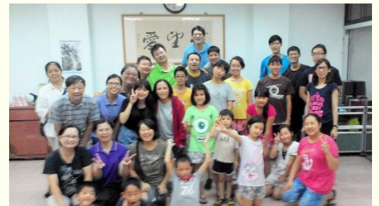
五會所兒童排的家長與孩子

定持續的操練。課程結束就是美勞製作或是團康遊戲，讓孩子們手腦協調，全人得着好的發展。最後有點心時間，孩子們排隊洗手，享用點心；家長們互相關心孩子們在家中、在學校的情形，而有經驗交流、彼此代禱。