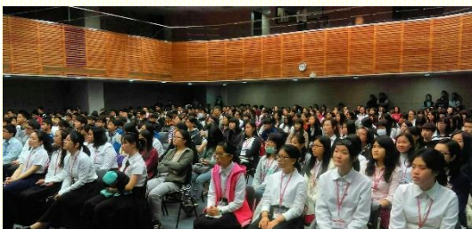
學生們專心聆聽福音信息

就是福音聚會，我特別喜歡青少年自製的微電影新鮮有趣。 其中一位姊妹的見證讓我很有感覺。因為我也有喜歡的事物，她追的是偶像，我追的是各種熱門的韓劇。偶像讓姊妹瘋狂，只要關於偶像的事一定