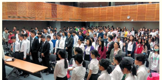
桃園市召會中學生集中擘餅聚會

福音信息以賈伯斯的夢想為例，他掌握數個國家經濟命脈，用科技改變全世界。看似很有價值的人生，但到一生末了他卻說：『如果我生前的一切，被死亡重新估價後，已經失去了價值！那麼現在我最需要甚麼？』由此問題引到神也有個夢，就是進