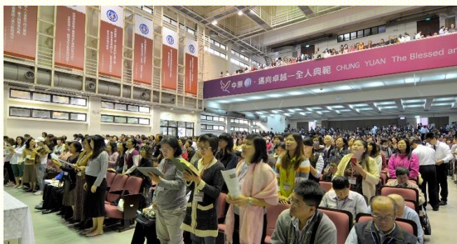
桃園市召會集中擘餅暨相調特會

十二月四日於中原大學中正樓舉辦的全召會集中擘餅暨相調特會，是桃園改制為直轄市後，第一次的集中聚會。兩千五百餘位聖徒同赴盛會，見證我們是一個召會，各會所不分彼此，顯出一個身體的實際。