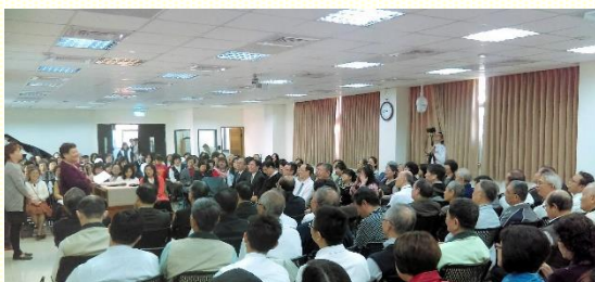
秋季聖徒成全聚會

這學期聖徒成全聚會延續上學期追求的進度，進入申命記的研讀。申命記是律法總結的話，