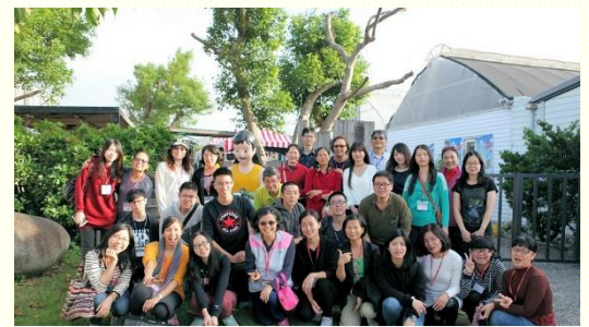
苗栗農莊全體青職合影

聽得津津有味、如癡如醉。我們就在這樣喜樂又帶點感性的氣氛中，到了今天的目的地——苑裡。