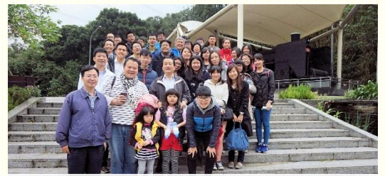
八會所青職聖徒相調

主纔是大事。操練將萬事帶到主面前求問，以主作智慧和平安。也當看重家庭生活，安家在召會。