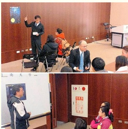
對福音朋友講說人生的奧秘

今年二月份各大學院校開學之際，二月十三日至二十七日有全桃的大學福音節期。在北區部份，二月二十三日，神在開南大學作了新事！因爲輪中套輪的經綸大輪所到之處，讓福音顯出神的大能。當天共有六個學生受浸。若看外面的環境不僅有寒流，也有四天的連續假期；若再想想已過開