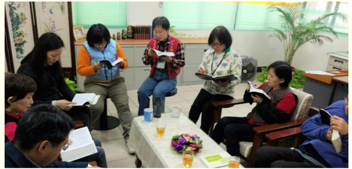
三會所職場小排一同追求聖經

小排之初，只有幾位同事來在一起，慢慢的主就將人加給我們，並且在該年年底結了第一個果子。如今排裏充滿剛得救的新人和福音朋友，只要大家時間來得及，總會盡力參加。原本顧慮中午用