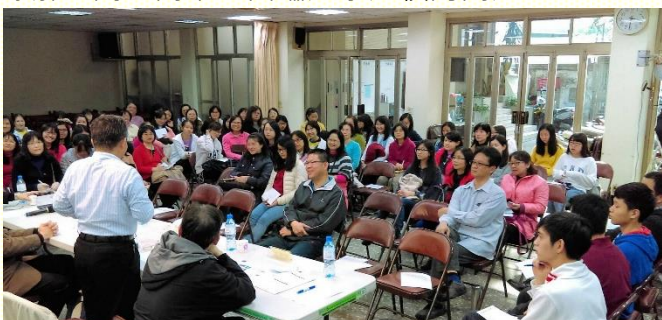
教授們生動豐富的見證與問答

—— ○一七年三月十一日首次於二會所舉辦全 —— 桃園高中生涯規劃座談。與會家長含服事者六十六位，學生三十七位，共有一百零三位，一同瞭解並關心高中生面臨選系選校的問題。