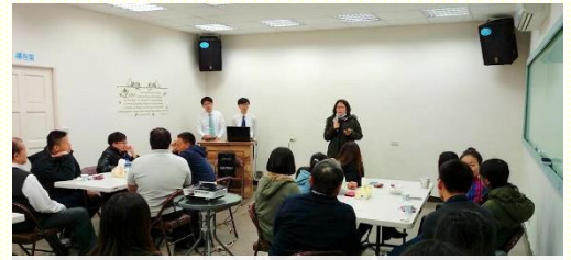
福音聚會學生作見證

見，神不是只要我們外在有一個福音行動，而是眾聖徒們能配搭成爲一個團體的實體來彰顯神。這也使我們爲這羣學生有更多的禱告，盼望他們能在後續的聯絡下早日得救。