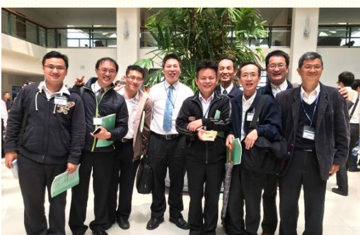
來自不同會所的弟兄們喜樂相調合影

第一篇信息說到信徒要尋求在上面的事。歌羅西三章一節，『所以你們若與基督一同復活，就當尋求在上面的事，那裏有基督坐在神的右邊。』這裏的『尋求』，意同於路加十五章裏婦人點上燈，細細的『尋找』失落的銀幣；又如同主撒下羊羣去『尋找』那失落的一隻，直到找着。因此，對於上