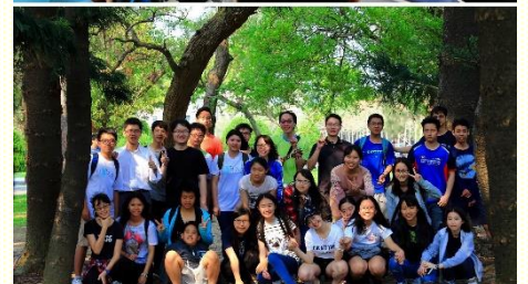
青少年主日聚會及戶外相調