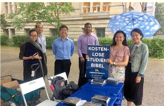
在柏林工業大學發送恢復本聖經

在校園開展，柏林的校園工作包括三所大學：洪堡大學（Humboldt）、柏林工業大學（TU Berlin）、自由大學（Freie）。週中每個校園有讀經小組，週五