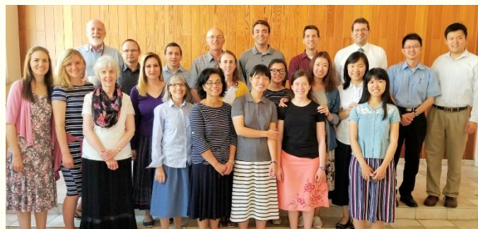
和開展隊友及杜賽多夫當地聖徒合照

這五週安排在杜賽多夫過召會生活，同配搭開展，牧養得救的波斯語新人。剛開始因為語言和文