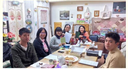
週六小排一同追求新約生命讀經

很喜樂，彼此的交通也很甜蜜。在追求生命讀經時，有時是操練用臺語來彼此對讀，弟兄姊妹反而更專注。也很享受每次小排聚集末了，彼此的代禱，顧到各個肢體的需要，叫衆人都得安慰和鼓勵。