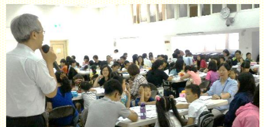
於一會所舉辦的暑期兒童園地

在二會所辦理的兒童園地，主題是『勤、大、細』。每一個主題包含客觀的真理教導和主觀的生活操練。課程內容配合詩歌、活動、學習單，讓孩子們把所聽見的啟示帶到生活中實際的操練、應用，來建立良好的品格。因着弟兄姊妹多分多方的禱告，當天兒童人數眾多，特別是其中有四十多位兒童是學齡前，比已往多了一倍，感謝主。在服事的弟兄