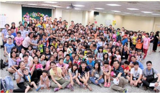
南區兒童與服事者合照