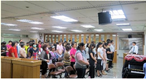
全會所福音收割聚會

從 六月底到七月中，藉着福音聚會和聖徒家打開的福音愛筵，主將十一個新得救的聖徒加給我們。六月二十四日，是我們上半年的全會所福音收割聚會，