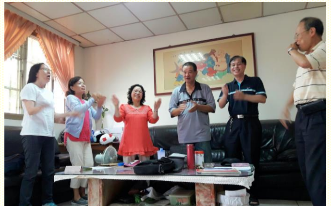
在新人家中陪伴家聚會

在生機配搭這方面，按着初信者的時間，有空的聖徒生機的分組配搭看望。有一次到了一位年長姊妹的家，姊妹熱切招呼我們，並述說帶她得救的姊妹常為她講聖經故事。我們想陪她唱一首臺語詩歌，她笑說老人家不會唱也不認得字。