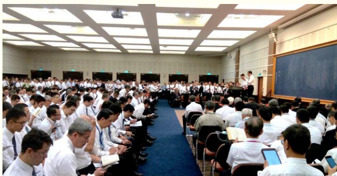
聚會中弟兄們進入信息負擔

這次弟兄說到，我們不單只牧養新人，也要牧養福音朋友。並繼續交通到，『基督身體的建造，不是倚靠少數人，不是倚靠召會的負責弟兄，也