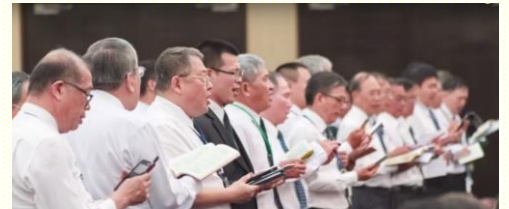
弟兄們同聲高唱詩歌

含註解及串珠、生命讀經、職事信息、屬靈書報等，但我們往往只是在草場上滑草，而沒有享受草場作食物，實屬愚拙。我們要接受主的託付，作牧人牧養羊羣，自己必須先喫飽喝足，纔能領羊進入基督這草場。藉着禱研背講，不僅使我們有享受，有飽足，而且使我們更多被真理構成，並有正確的申言以建造召會。