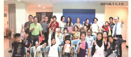
十八會所兒童排及親師座談會