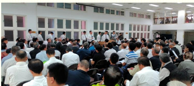
秋季弟兄事奉相調特會

有堅定的意願要得着召會作祂的彰顯，求主保守我們都活在祂的心意裏。我們不僅要傳揚基督那追測不盡之豐富的福音，更要將那隱藏在神裏之奧秘的經綸——召會，向眾人照明。召會原初的情形是美好的：信徒不分階級，完全和世界分別，完全斷絕偶像，並完全讓神說話。一地一個召會，一個基督身體的顯出；各地召會行政獨立，交通卻是宇宙的，沒有總會或聯合會。眾召會尊崇基督元首地位，讓聖靈掌權。但因着仇敵的破壞，以致召會墮落了，所以需要恢復到原初的情形。