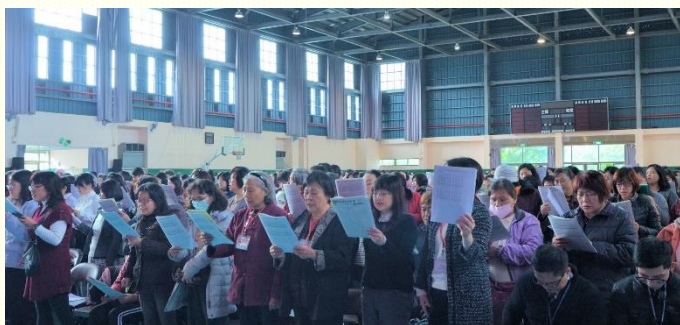
全召會集中擘餅聚會聖徒唱詩

氣氛，有一百多位青職聖徒整齊的站在臺上領詩，帶領衆聖徒同唱『過節』與『召會生活輝煌之至』，就在這喜樂高昂的靈中，開始了這次的聚集。前段的擘餅聚會，衆人藉由詩歌『召會的讚美』一同在剛強的靈中向主獻上讚美。當弟兄們同擘一餅時，我們真能見證在此聚集人數雖多，我們仍然是一，這一使主心滿意足。