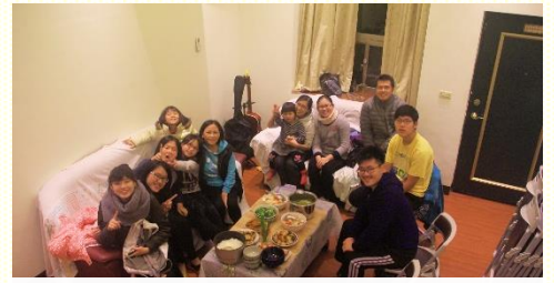
聖徒與學生同聚小排享受主

過越豐富，牧養人的與被牧養的，在身體的交通與調和中，得着平衡與保守，也漸漸除去聖徒與學生間的距離與阻隔，在愛裏有真實的建造。