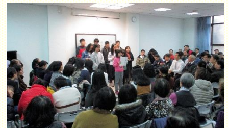
五會所聖徒見證展覽

五會所年終感恩聚會，共分兩個階段進行。首先於十二月中旬，有成功二區、復華區、興仁區及成功一區的小