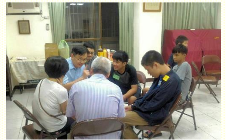
聖徒傳講人生的奧秘

及受浸的意義。這樣的調整，使二十至三十位的弟兄姊妹能以盡功用，而不只是坐在臺下陪伴。結果當天有十一位福音