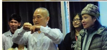
兒童展覽與手語聖徒展覽

（二）利用事前的週二禱告聚會，主答應我們的禱告，席開二十五桌並整場滿座。（三）憑着信心由弟兄姊妹自由奉獻，經歷主加給我們的綽綽有餘。（四）聚會內容精彩豐富，有年長、兒童、青少年、大學生、手語聖徒的各項展覽，以及社區聖徒