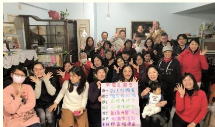
聖徒宣告今年的展望

展望新的一年，二會所盼望有新的起頭，新的復興。五會所期盼在元智校園得着更多青年學生；社區福音也藉着兒童排及幼幼排的配搭經營下，為兒童撒生命的種子，並得着兒童的父母，使青職的家成為福音的站口並召會的中幹。九會所弟兄姊妹們願意更新奉獻給基督與召會，建立每日對主的享受，每週與身體同聚集，並持續盡福音祭司的職分。而十四會所在今年的第一天清晨，有七十位聖徒相約前往石門水庫晨興、禱告，將自己更新奉獻給主。願主在新的一年里繼續帶領我們往前！