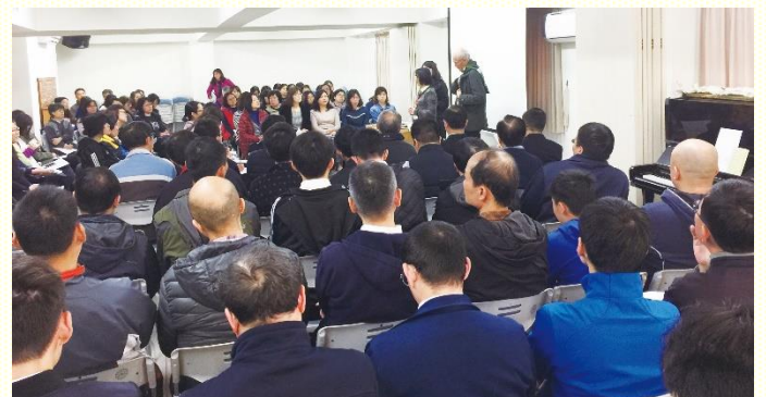
家長見證如何牧養兒女

詩篇一二七篇三節說：『兒女是耶和華所賜的產業…』。為着這次的成全聚會感謝主，對於兒女