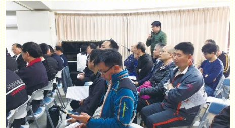
小組討論後的分享

這 次成全聚會，是我與弟兄受浸兩年多來，第一次一同參加的成全聚會。參加原因並不是因為我們是服事者，而是因為我們家有個年值十六歲，處於學業、人生十字路口的慘綠少年。我和弟兄覺得能參加聚會是受主成全的機會，可以得着許多服事者及父母的過來人經驗談。