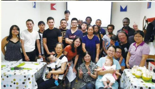
本國與外籍學生在英語排中喜樂合影

宗教背景。藉由每週進入生命課程，使他們認識職事的說話，學習被真理構成，並能在生命的經歷上長大。幾位天主教背景的學生，因着真理的話，使他們有得救的智慧，先後在英語排中受浸得救。這些外籍留學生多半是研究生，無法久留，造成英語排成員流動率很高。有一位學生準備離開臺灣時，向聖徒們說，他回到家鄉也要與服事的聖徒一樣，作相同的事。這使聖徒深受感動，一切的花費都是滿有價值的！