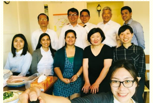
與當地聖徒及學員用餐前合照

弟兄帶來目前德國開展的負擔：第一，在衛星城市建立金燈臺；第二，得着德國校園青年；第三，得着社區的家；第四，牧養波斯語聖徒。盼望在臺灣的聖徒們也能為着以上負擔持續代禱。主在帖撒羅尼迦前書一章五節曾說：『因為我們的福音傳到你們那裏，不僅在於言語，也在於能力和聖靈，並充足的確信』，盼望我們在此福音的傳揚是藉着那靈充滿和充溢，使基督在我們身上有自然的流露。