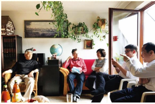
與當地聖徒及學員交通相調