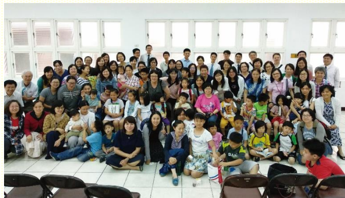
北區會後團體合照

兒童主日服事者成全聚會，由北區、南區兩地分別於五月十九日舉辦。目的乃是讓服事者依所需及負擔，得以因地制宜外，也能讓參加的聖