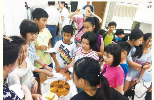
少年排兒童聽故事、享用蛋糕

聚會雖然結束，仍有部份的孩子留在會所打乒乓球，直到六點家長們纔陸續接回家，渡過了一次喜樂的少年排。