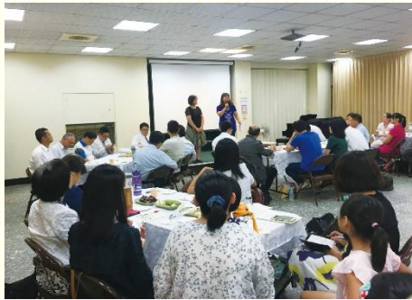
南區會中見證分享

林 前十五章十節：『然而因着神的恩，我成了我今天這個人，並且神的恩臨到我，不是徒然的；反而我比衆使徒格外勞苦，但這不是我，乃是神的恩與我同在』。去年初因着年幼的孩子漸長，經由姊妹邀約，我開始配搭兒童服事。而家中還有三個孩子要照顧，因此時常不住的禱告，求主給我毅用的恩典。