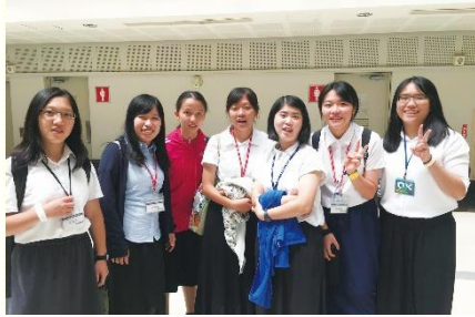
桃園參加的姊妹們會後合照

在這次特會也遇到很多高中一週訓練的同伴，發覺時間過得很快，高中三年一下就過了，所以需要把握接下來的