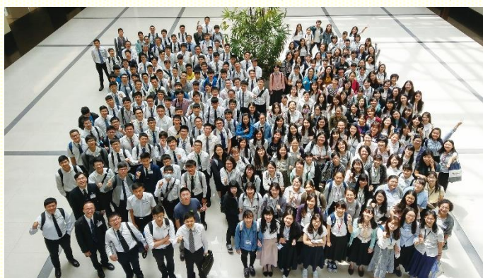
全臺大學新生聖徒特別聚會合照

在七月二十四至二十六日三天，有全臺大學新生聖徒的特別聚會，這是為着升大一的弟兄姊妹恢復了暫停十多年的聚集。桃園共報名參加二十四位準大一生。還有許多從各地前來的弟兄