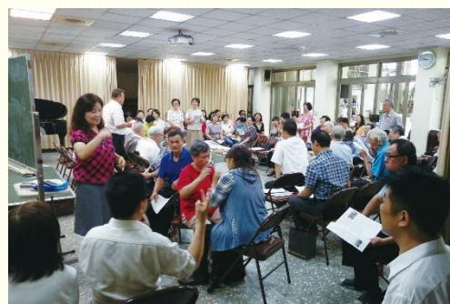
二會所聽損聖徒主日聚會

事？也因着神的憐憫，我們得着兩位又聾又瞎的姊妹，其中一位姊妹的丈夫因此得救。現在過着正常的