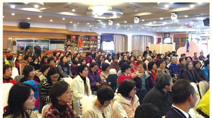
眾人享受聚會的展覽與見證