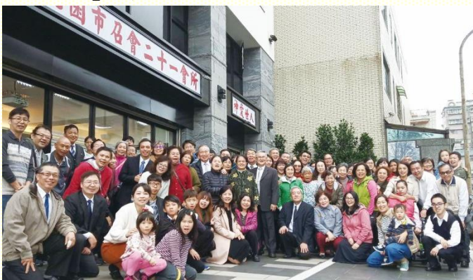
二十一會所成立聚會門前合影

因着大竹地區移居人口越來越多，主要街道的大竹路上，有許多教會陸續成立，弟兄們看見這乃是神應許的美地，有迫切的需求要得着這地。神說：『看哪，我將這地擺在你們面前；你們要進去得這地…』（申一八）。