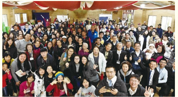
年終數算主恩聚會

聚會末了，弟兄以幾句話鼓勵我們。第一、願我們『天天』真實的享受主，使我們對基督的享受不是可有可無，而是每一位聖徒都被帶回到基督作我們真實的享受裏。第二、『人人』需要作活力