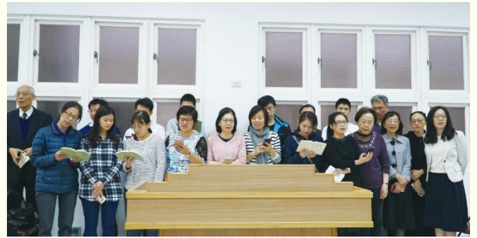
弟兄姊妹上臺展覽蒙恩

面對孩子、家務、上班的生活，體力是很大的挑戰，聖徒總覺得無法參加晚上的禱告聚會。有了姊妹的陪伴，開始過天天晨興的生活，恢復向着主的愛並受激勵；摸着神的心意，是要建造基督生機的身體。聖徒看見需顧到神的權益，不再只顧到自己的生活，願意與弟兄姊妹相調在一起。同時，在