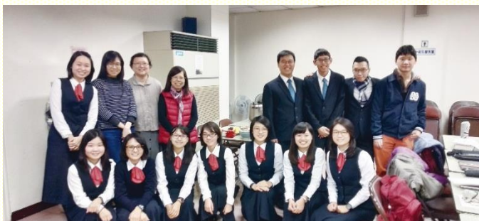
學員們與聖徒愛筵時合影

每 年冬季，臺灣福音工作全時間訓練學員將走訪全臺基督教各會堂，推廣職事書報的豐富。從二〇一八年十二月二十八日至一月七日，為期十天，學員分作十二隊，分別在臺北、新北、桃園、竹苗、臺中、臺南、高屏等地區推廣。此次主要推廣的十本好書有『愛神』、『神中心的思想』、『到榮耀裏去的路徑』、『神人調和與復活的原則』、『這人將來如何』、『事奉配搭與愛中洗滌』、