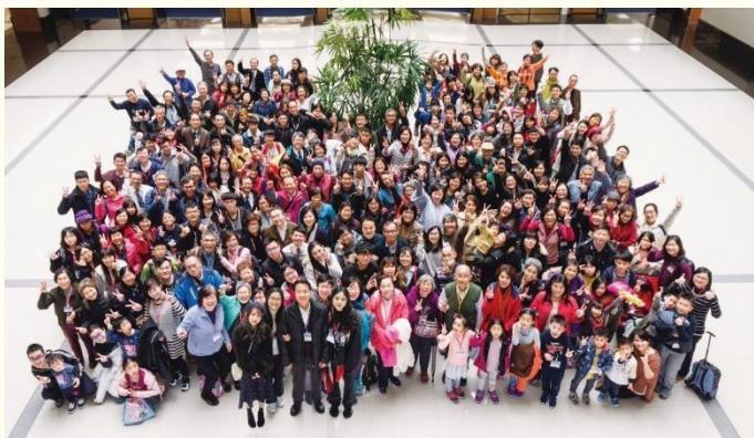
八、二十一會所聖徒於中部相調中心合影

八會所、二十一會所於十二月三十至三十一日，前往溪頭戶外踏青，再移至中部相調中心有擘餅暨年終數算主恩聚會。弟兄姊妹也抓住機會，和草屯鎮召會聖徒有相調，彼此分享召會生活中實行神命定之路具體的蒙恩。本次與會的聖徒及福音朋友共有二百六十位。回想已過一年，因着主的祝福和北區各會所同心合意配搭開展，去年十二月十六日在大竹地區成立二十一會所。對於新的一年有以下展望：不斷挨家叩訪，持續得着新人。普遍關心聖徒，建立美好生態。積極供應餵養，追求生命成長。加強相調訪問，落實身體生活。重視三大專項（兒童、青少年、青職），維持代代相傳。