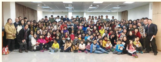
十六會所聖徒會後喜樂合影

十六會所於十二月三十日擘餅聚會後，舉行年終數算主恩聚會。與會聖徒與福音朋友一百七十六人，兒童三十人。共有四點蒙恩：第一，有分全召會傳福音行動：去年年初配搭開展十九會所；四月份配搭僑愛叩門傳福音，聖徒更有負擔為着當地的擴展；十月份至大園、大竹開展福音。第二，國際華語特會接待相調：本次接待菲律賓聖徒，許多弟兄姊妹早有豫備，接待遠方的親人，眾人皆相調喜樂。第三，一年讀舊約聖經一遍：各區推動讀經報號，每季辦理讀經獎勵，集中主日聚會有讀經心得分享，激勵聖徒追求主話，被真理構成。第四，實行家聚會使人數繁增：聖徒普遍實行週週牧養，使召會滿了愛和彼此相顧，人數得以繁增。