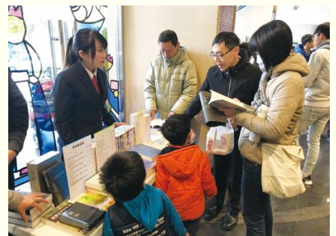
許多聖徒渴慕主話，出代價尋求真理

弟兄姊妹藉着我們介紹及擺攤推廣，十分願意出代價買真理。同時，不僅牧者渴慕並贊同我們書房的出版，也積