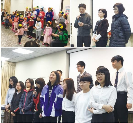
兒童與弟兄姊妹上臺展覽

之後由各專項展覽，見證主的恩典。兩位姊妹分享開家作兒童排的蒙恩；其中一位姊妹見證，雖然先生還未得救，卻支持打開家作兒童排，讓姊妹