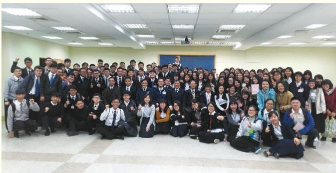
現場訓練會後合照

這次結晶讀經，主要是進入民數記一至九章，特別是從標語可以看見其啓示與負擔：第一，神渴望得着一個團體的人，代表祂從撒但霸佔的手中征服並重新得回這地，因此神所揀選並救贖的人需要編組成軍，與神一同前行，並為着神在地上的權益與神一同爭戰。第二，神渴望祂所有的子民都是拿細耳人；作拿細耳人乃是絕對且徹底的成為聖別，分別出來歸給神，就是不為着別的事物，只為着神，只為着神的滿足。第三，我們作為基督的同夥為着神的權益爭戰，需要相信神的話，藉相信神而尊重祂，看見由美地所豫表包羅萬有之基督的異象，並且要征服撒但的混亂，而在神聖的經綸中得勝。第四，基督從祂的成為肉體，經過祂的升