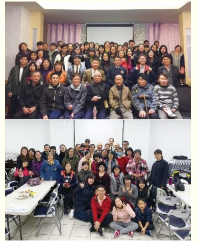
五會所各區年終聚會合照

藉由追敘往事，帶給我們三重益處。第一，新的亮光、新的啓示，幫助我們認識神的心和神的手。第二，幫助我們認識自己，定罪肉體。第三，學習拒絕己和肉體。『求你指教我們怎樣數算自己的日子，好叫我們得着智慧的心』（詩九十 12）。『…我只有一件事，就是忘記背後，努力面前的，向着標竿竭力追求，要得神在基督耶穌裏，召我向上去得的獎賞』（腓三 13~14）。盼望新的一年，緊緊跟隨使徒的教訓與交通，同心合意走神命定之路，福家排區、生養教建成為我們的生活，一同建造基督的身體，終極完成於新耶路撒冷。