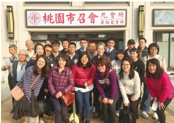
聖徒們與學員開展前合照