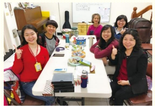
新人得救後續的牧養家聚會

近三週的福音開展，我們遇到許多平安之子。在其中一天傳福音時，在宿舍門口遇見我的朋友，隨口邀約她晚上來會所喫飯，沒想到她真的答應了。並且在與服事者們配搭傳講人生的奧秘後，這位朋友就受浸得救了。得救後，服事者與我配搭陪伴姊妹建立家聚會，以『高品福音』小冊陪讀，多有關心並陪同禱告。求主繼續堅固小羊的心，穩定的享受主的話，與我們同過喜樂的召會生活。