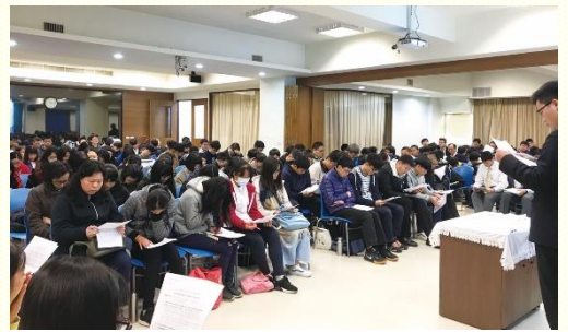
青少年們專心認真進入信息負擔

十次，並每週操練禱背一首關於愛和恩典的詩歌。第三，奉獻每週為一位同學禱告，並至少邀約兩位同學來聚會。藉着這次的期初特會，青少年都更新奉獻自己，作拿細耳人滿足神的心願。