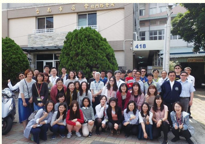
與臺南聖徒喜樂相調