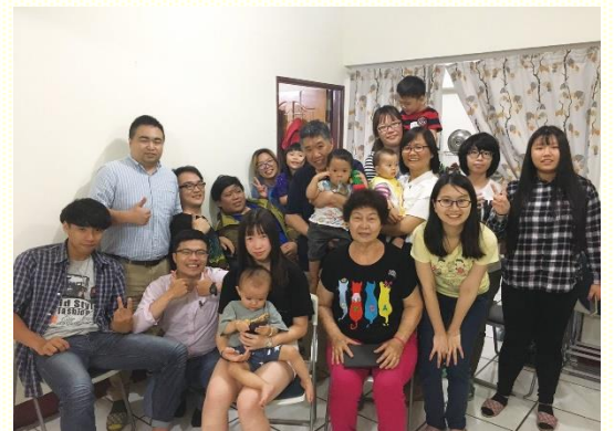
青職排弟兄姊妹喜樂合照