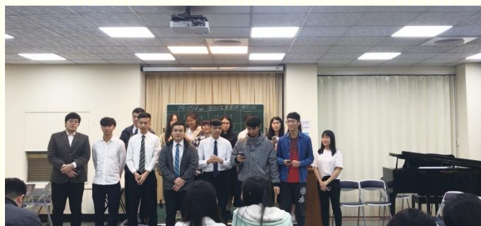
學生宣告福音節期目標

音有兩個原則，傳福音不僅需要在靈裏，更需要運用信心為同學題名禱告。傳福音首要的是將自己禱告到靈裏；為福音的傳揚禱告，該求的第一件事不是拯救別人的能力，而是使自己得以加強到靈裏的能力。這樣的禱告是將禱告的人帶進調和的靈裏，而有靈中的火熱。接着需要運用信心，將主託付的人一一題名在主面前代禱。這樣在靈裏並運用信心的禱告，就像是為福音『火車』鋪設『軌道』；軌道鋪到那裏，火車就能開到那裏。