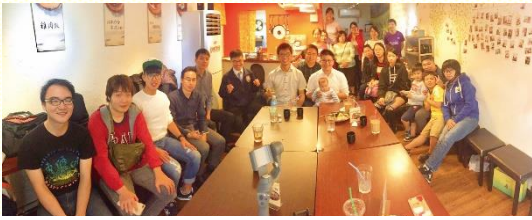
青職排弟兄姊妹用餐相調

一、青職人數增加：原本在觀音聚會的青職不多，因着青職排週週相聚，每一位弟兄姊妹都得着顧惜及餵養。有許多弟兄姊妹剛到這裏工作，人生