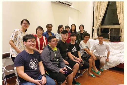
元智大學福音餐會合影

除了出外訪人外，各校也舉辦多場福音茶會與收割聚會，將所接觸的、敞開的、或在牧養中的福音朋友，班上的同學，都邀來聚會中，收割發白的莊稼。在聚集裏，學生們各盡功用，領詩、