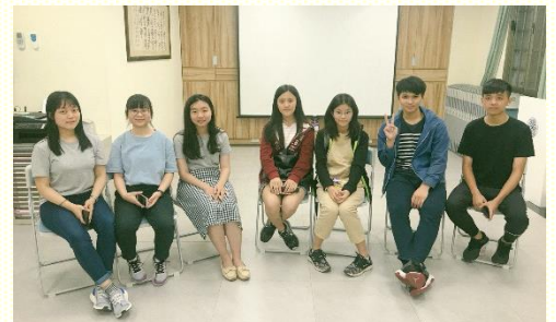
中原大學福音茶會合影

感謝主使我看見，我是在一個身體裏，需要配搭在身體裏，軟弱也要倚靠身體，不是憑自己一人努力想要得着甚麼。我不能作的，身體裏別的肢體