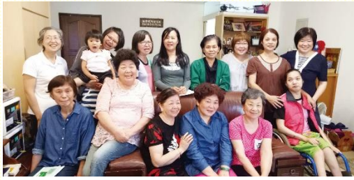
喜樂結新果的讀經排

本於祂，全身藉着節和筋，得了豐富的供應，並結合一起，就以神的增長而長大』。在召會生活中，因單純的愛主、相信主、接受主、享受主，而滿了喜樂，讓我們這小小的肢體，不再孤單。因祂是我們的產業，我願作祂愛的俘虜，永遠投奔祂！