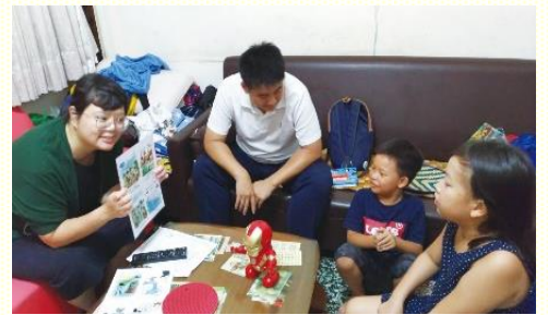
陳先生家兒童聚會

神的心而斥責仇敵的作為；求主藉由得着孩子而得着一個個的家，成為這地的見證。在這次行動中，