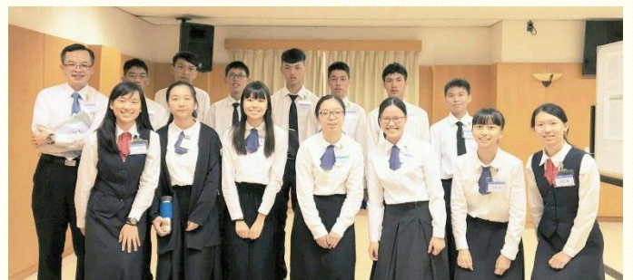
參加高中一週訓練的高中生與服事者合影

學員們也奉獻，校園中有他們在，就要叫主的福音有出路！與同伴們彼此激勵，當一人受主感動，全體跟着向前衝。