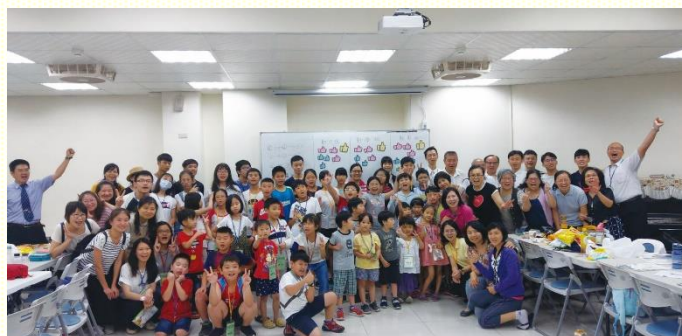
暑期兒童園地喜樂大合照

有些不願意。因自己覺得忙碌中不漏掉聚會就很不錯了，實在無力構上這分服事。然而，藉着晨興享受到，『在魂裏是一，魂裏聯結，不僅是為着經歷基督，更是為着享受基督；我們對基督的經歷，也該是對基督的享受』。感謝主，在這兩天的暑期兒童園地配搭，就不再有怨言及疲累，卻是滿滿的喜樂，因為能跟親愛的弟兄姊妹在同一靈裏，並同一魂裏經歷基督、享受基督。