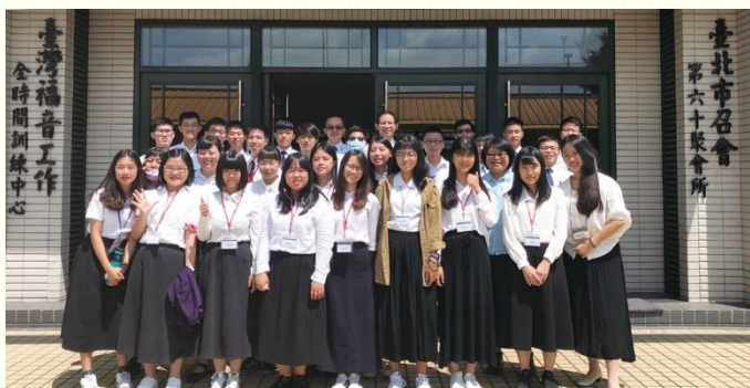
桃園參訓學生合照

除了正式的課程，也安排屬靈問答的時間，讓新生們自由提問，其中包含傳福音、讀經、禱告、召會生活、入住弟兄姊妹之家等問題。答題的弟兄鼓勵新生們多花時間在主的話上，將聖經多讀幾次，好明白神在人身上的旨意。