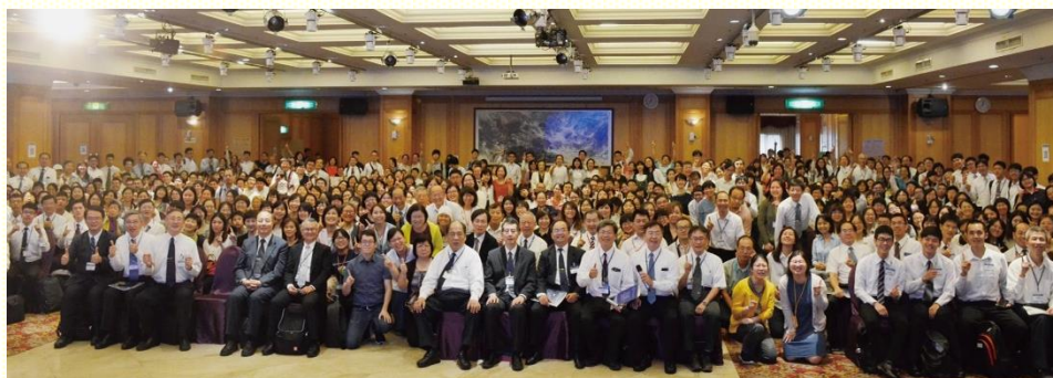
全臺眾召會路加集調於桃園合照

麼可能接下這個負擔呢？原要拒絕，經過多次與長老及同工弟兄們的交通，看見自己真是信心不