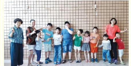
兒童完成美勞並與服事者合照

在他身上的變化和製作，讓我覺得自己更要出來服事，趁着體力還構得上，讓所有的孩子都可以來到主日聚會，到主這裏來』。