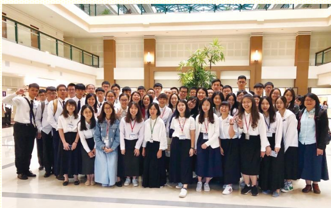
桃園大學聖徒特會中合影

大一新生也奉獻未來四年的生活，要在弟兄姊妹之家受成全，向同學傳揚福音，並帶同學得