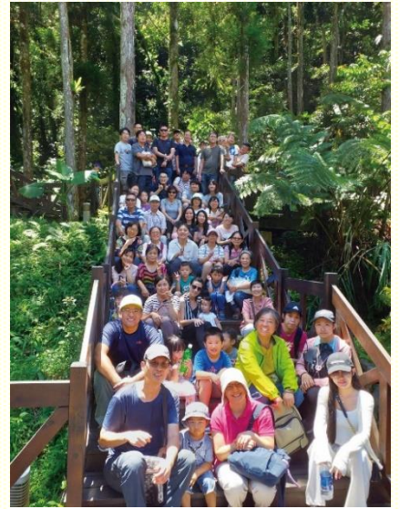
青職聖徒於滿月圓相調合影