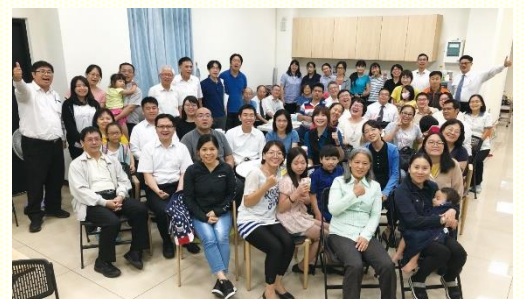
兒童服事相調團體合照

功用。不僅堅定持續有兒童工作的服事，其他聖徒也傳福音給社區居民，甚至學習經營社羣網站，因而能與他們更為貼近。