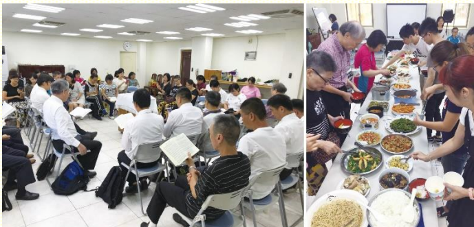
聚會中眾人唱詩歌並同享愛筵

會中安排兩位聖徒作見證。一位得救不到半年的新人，作了新鮮活潑的見證，他在講說見證