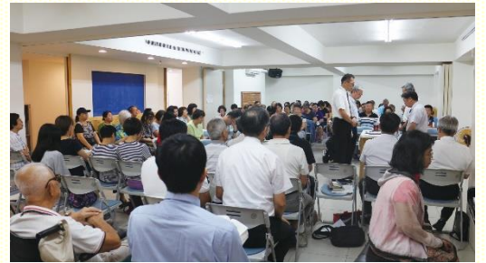
集中擘餅暨福音詩歌饗宴

來了一百二十二位的聖徒和朋友。本次翻轉了已往福音聚會的方式，由四個區各挑一首與主題『召會生活』相關的詩歌，每一區有二至三位的聖徒分享對詩歌經歷的見證與