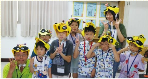
孩子們戴着蜜蜂頭套與服事者合影

這次品格園專講『勤』的性格，不但禱告要勤，且要在靈裏火熱般勤服事。特別弟兄很有智慧的设计，讓孩子們現場製作可愛又亮眼的蜜蜂頭套；