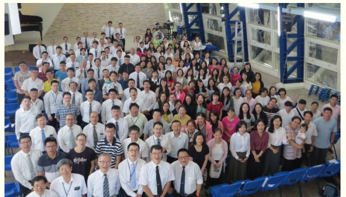
全召會青職特會合照

藉由六篇信息，幫助青職的弟兄姊妹看見主恢復的異象，並被這異象所管制，在這世代作主的金燈臺，為主發光。然而，這樣的目標並不是單獨的聖徒可以完成或達到的。這需要藉着主恢復基督身體真正的一，聖徒認識真理並在復活裏過十字架的生活，如同發光的星一樣，至終這班聖徒被編組成神的軍隊而達到的。