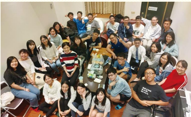
桃園大專聯合開展

因着全召會為福音節期的禱告，並聖徒與學生們同心合意的配搭，主就持續將得救的人數加