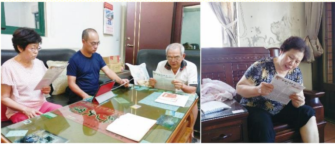
週週送會到家，分享週訊內容

歷經三年多的實行，蒙恩的點列述如後：第一、落實聖徒『缺一不可』，牧養範圍『沒有死角』，