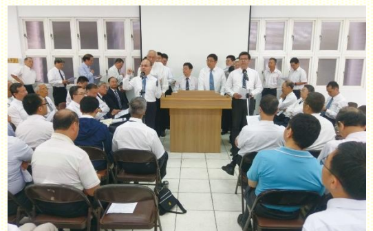
弟兄們在特會中上臺分享

律法，而在祂自己裏面創造了一個新人。主恢復的目標是要產生一個新人。為着一個新人的實際出現，舊人的整個人位就必須除去，並且聖徒們必須憑基督作為新人位而活。